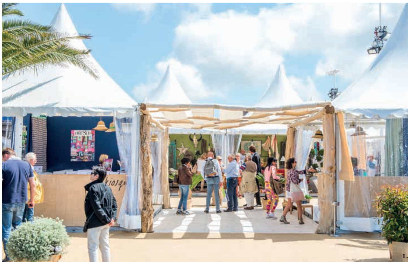
1. L'entrée du salon